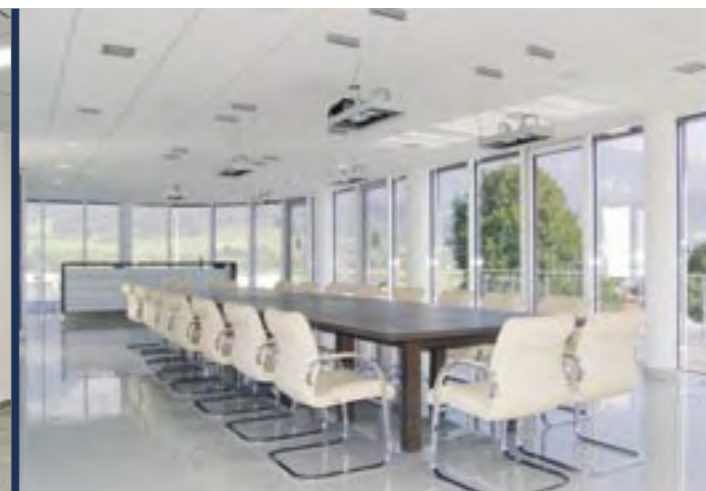
Besprechungen finden auf höchster Ebene statt