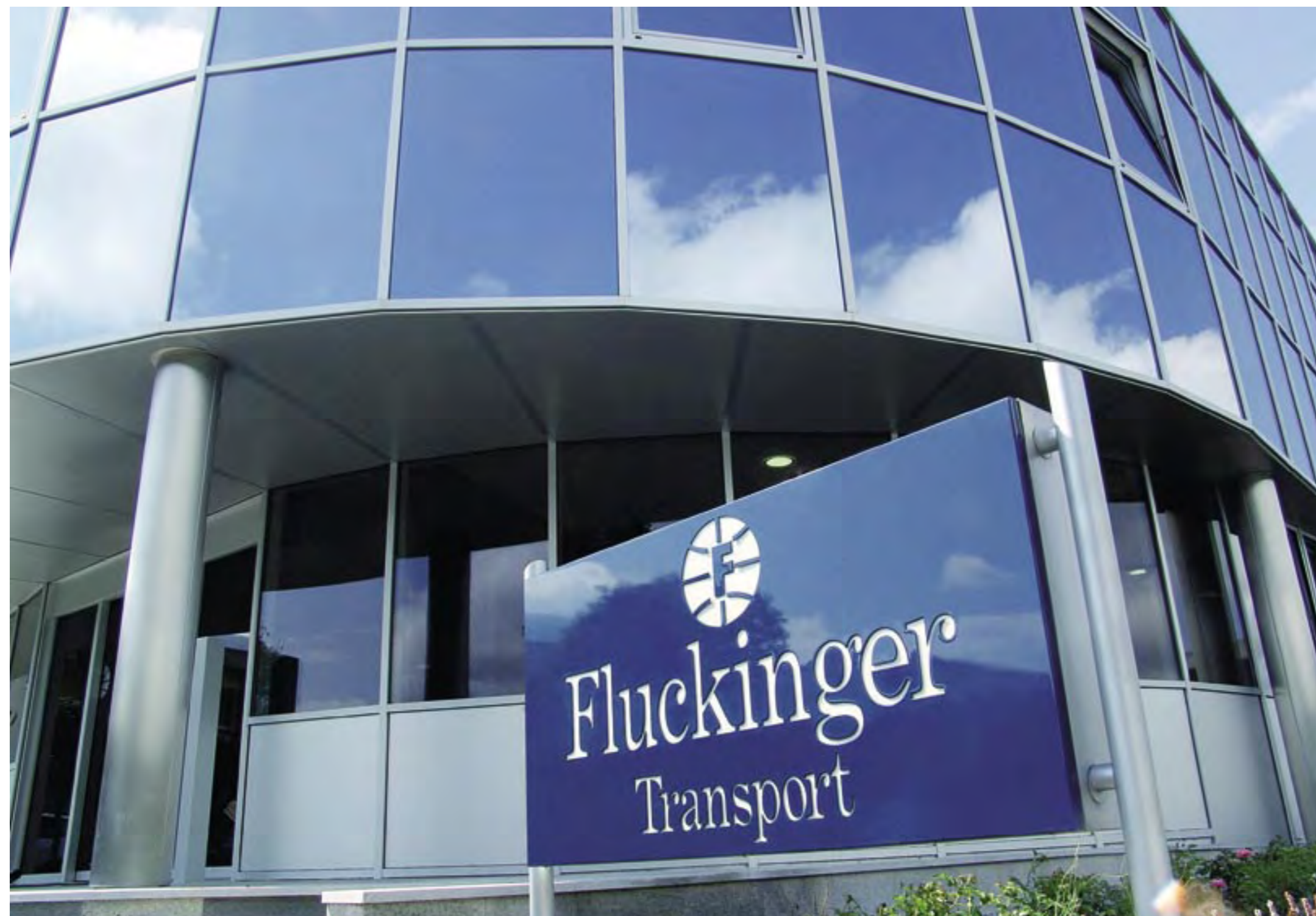
Die Europazentrale von Fluckinger Transport

Fluckinger Transport GmbH ist seit der Gründung durch Andrá Fluckinger im Jahr 1979 kontinuierlich gewachsen, bereits 1987 wurde eine Tochterfirma in Eskilstuna/Schweden eröffnet. Heute zählt das Tiroler Vorzeige-Unternehmen 250 Mitarbeiter und hat sich auf den Transport von Bau- und Sondermaschinen spezialisiert.