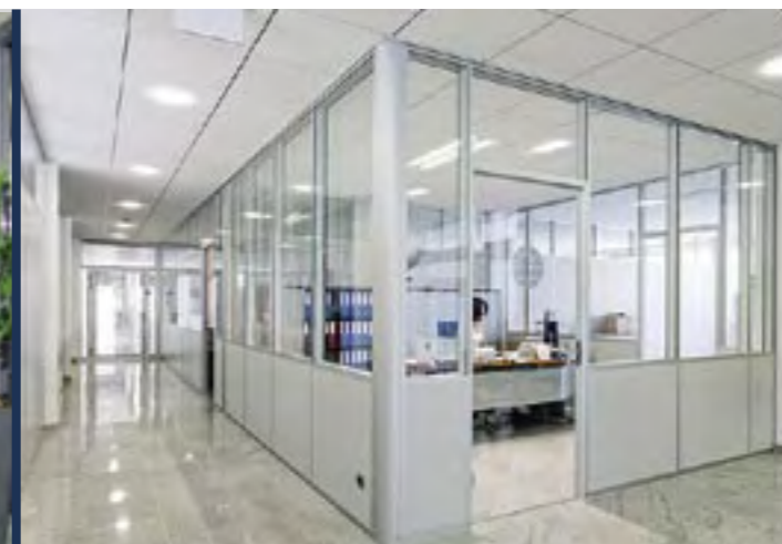
Helle und freundliche Büros