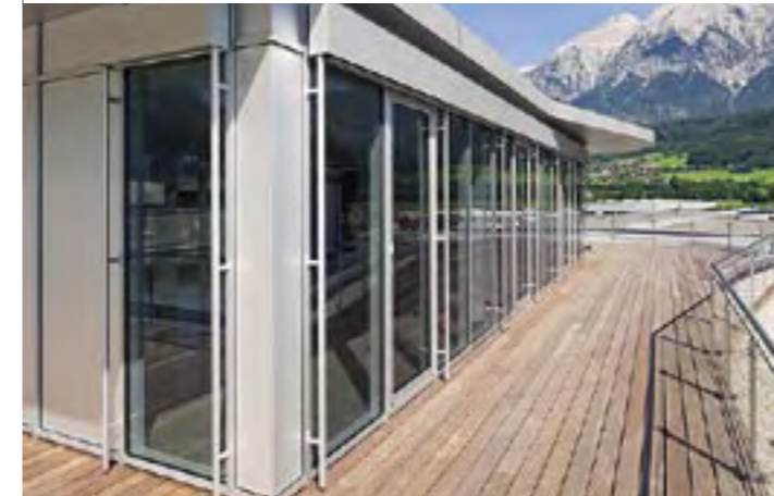
Freiflächen für Besprechungspausen