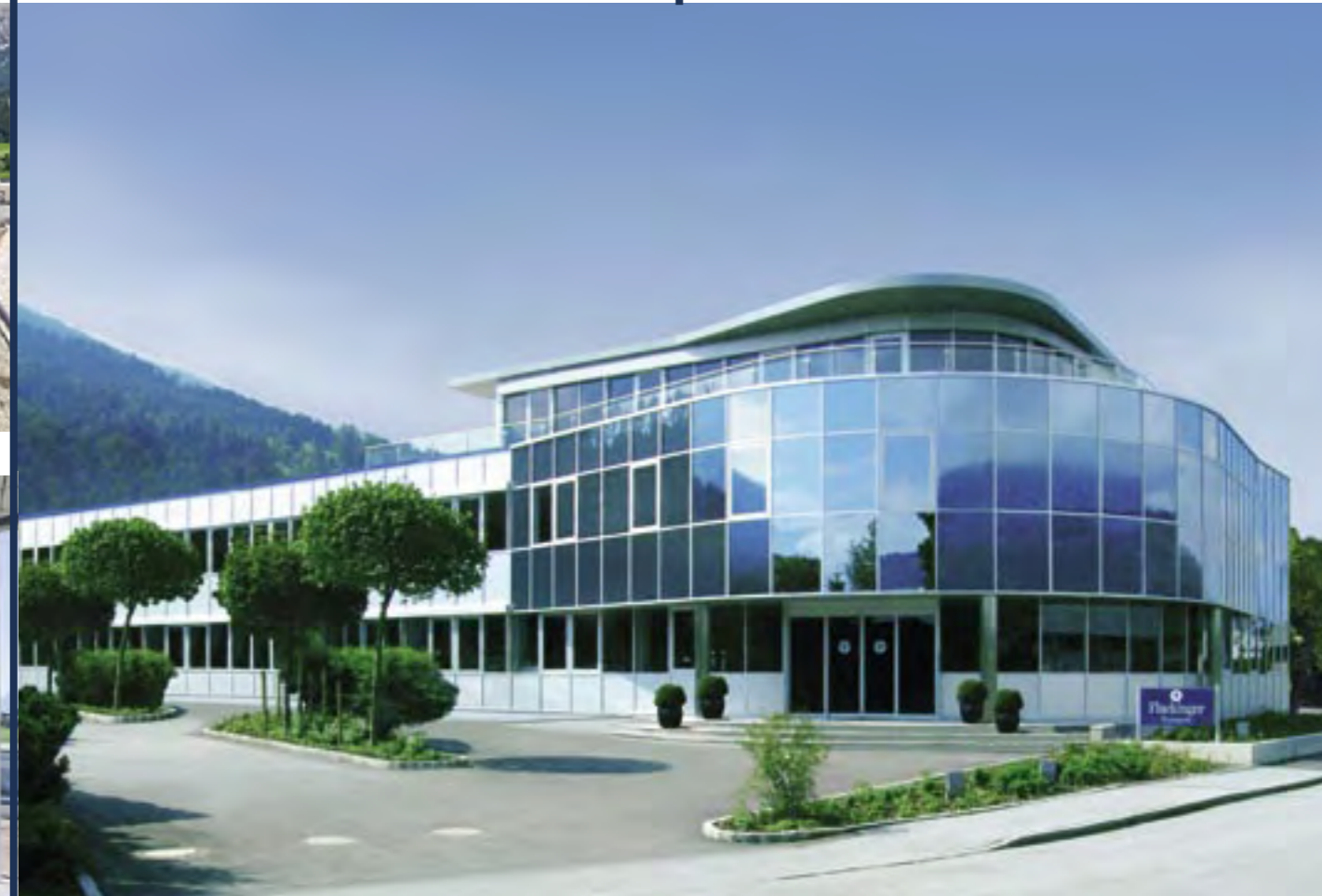
Die Vorderansicht des Bürogebäudes