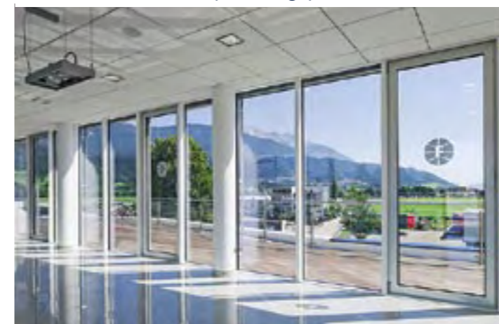
Transparenz in allen Bereichen